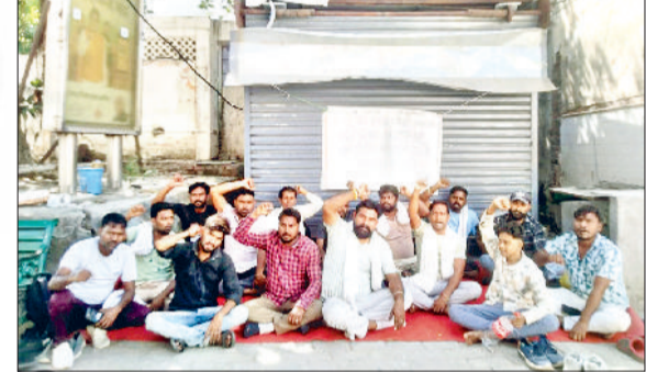
सोनीपत। नगर निगम में विरोध प्रदर्शन करते सफाई कर्मचारी।