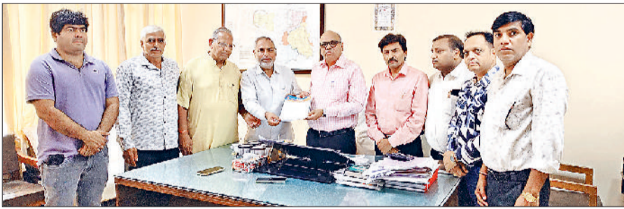
आबकारी एवं कराधान अतिरिक्त आयुक्त को ज्ञापन सौंपते संघ के पदाधिकारी।

मानव अधिकार संरक्षण संघ ने मंगलवार को आबकारी एवं कराधान के अतिरिक्त आयुक्त को ज्ञापन सौंपा। ज्ञापन में राजीव गांधी एजुकेशन सिटी सहित एसआरएम यूनियर्सिटी और जिनदल यूनियर्सिटी जैसे प्रमुख शिक्षण संस्थानों के आसपास सिगरेट, तंबाकू और एल्कोहल की बिक्री पर तत्काल रोक लगाने की मांग की गई। संघ ने अपने ज्ञापन में तर्क दिया कि शिक्षण संस्थानों के 100 मीटर के दायरे में नशे से संबंधित उत्पादों की बिक्री सीओटीएफ्ट एक्ट 2003 के प्रावधानों का उल्लंघन है।