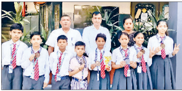
सोनीपत। विजेता विद्यार्थियों के साथ प्राचार्य एवं अन्य।