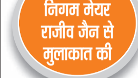
हरिभूमि न्यूज सोनीपत

जब तक कर्मियों को कार्य पर नहीं लिया जाता तब तक आंदोलन जारी रहेगा