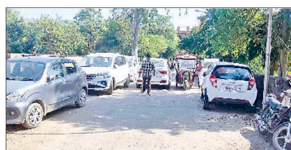
गन्नीर। उपमंडल अस्पताल के गेट पर बनी अवैध पार्किंग में खड़े वाहन।

उपमंडल अस्पताल के मुख्य द्वार के बाहर लंबे समय से खड़ा रही अवैध पार्किंग अब मरीजों और एम्बुलेंस सेवाओं के लिए बड़ी समस्या बन गई है। अस्पताल के गेट के ठीक ऊपर