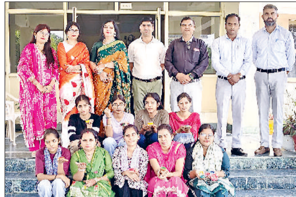
गोहाना। सजाए गए दीये दिखाते हुए छात्राएं, साथ में है स्टाफ सदस्य।