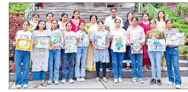
सोनीपत। प्रतिभागी छात्राओं के साथ प्राचार्या एवं अन्य।