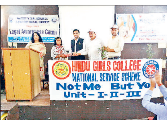
सोनीपत। शिविर में विद्यार्थियों को सम्मानित करते हुए।